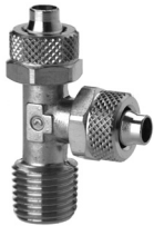
Lateral BSPT Male Tee